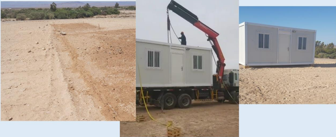
Foto del terreno y container donado por la empresa CMP